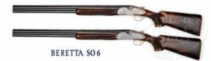
BERETTA SO 6

Razlika između DT 10 i DT 11 je u tome da je čelični otkovak, od koga je nastala baskula, sada još robusniji, tako da su bočni zidovi baskule širi i deblji. Time je i cijela puška dobila na čvrstini i izdržljivosti. Svi renomirani proizvođači podvlače čvrstinu i izdržljivost svojih sportskih pušaka, jer se radi o teško