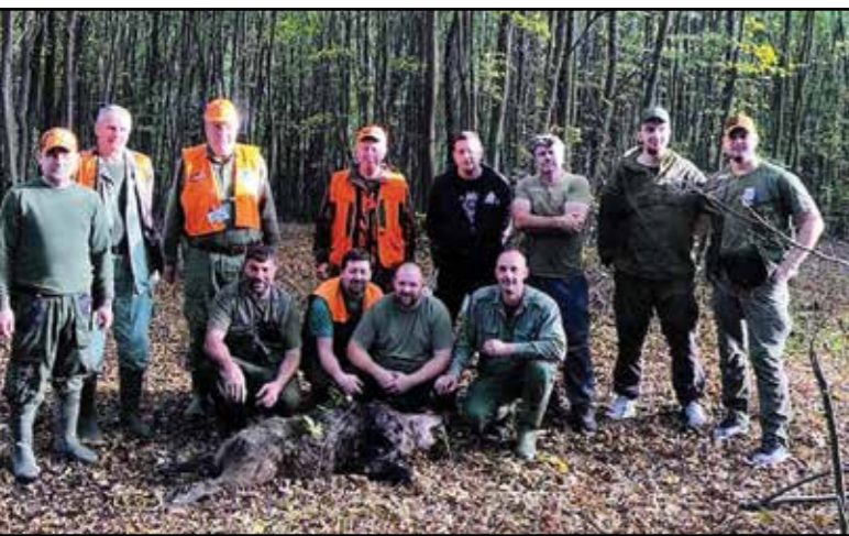
Lovačko društvo „Jelen“ Gradačac