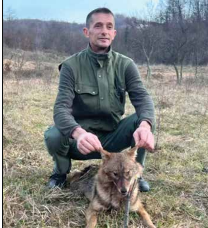
Lovačko društvo „Sokolina“ Kladanj