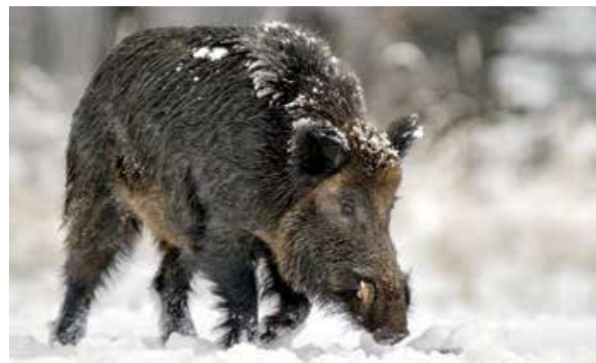
10 Lovac Decembar 2021