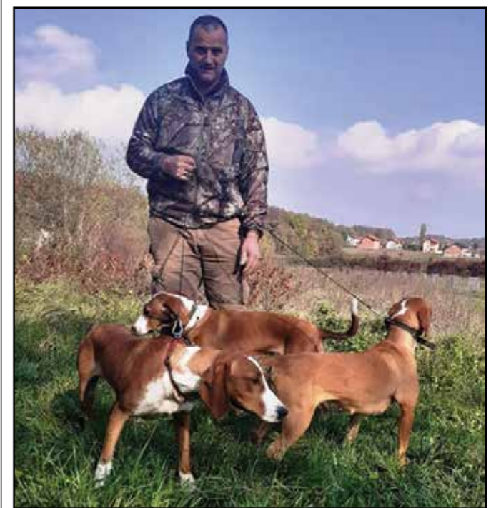
2021 Decembar Lovac 5