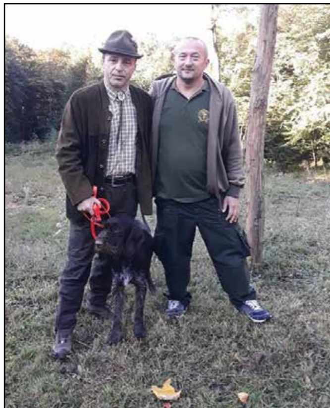
4 Lovac Decembar 2021