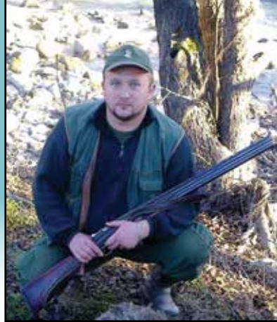
Piše: Selver Pirić