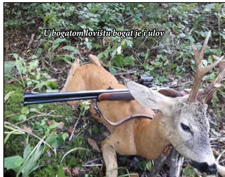
U bogatom lovištu bogat je i ulov