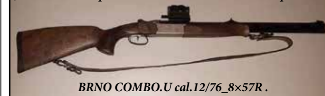
BRNO COMBO.U cal.12/76_8x57R.

Jedna od veoma pouzdanih kombinovanih lovačkih pušaka.