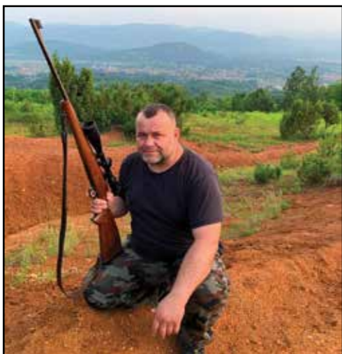
Završene pripreme za obilježavanje Dana SLD TK

Lovačko društvo „Spreča“ Kalesija lje uspješno završilo pripreme za domaćinsko obilježavanje Dana SLD TK. Dakle 7. septembra sve prisutne čekaju ugodna iznenađenja s bogatim kulturno-zabavnim programom.