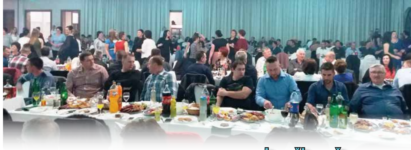
Lovačko društvo „Majeвица“ Srebrenik