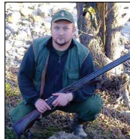
Piše: Selver Pirić