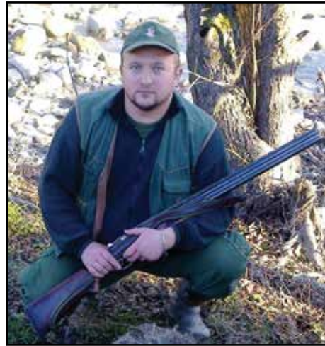
Piše: Selver Pirić