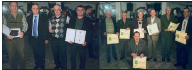
Lovačko društvo „Srndać“ Gračanica