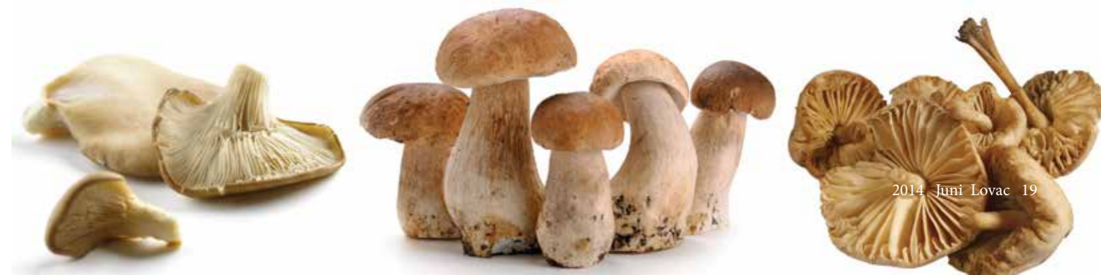
2014 Juni Lovac 19

AIDS-a, a takođe i na pacijentima oboljelim od tumora na mekim tkivima dokazali su ljekovitost zec gljive. Za razliku od drugih gljiva sa ljekovitim svojstvima, maitake pored rastvorljivih polisaharida sadrži i nerastvorljive kiseline. Zahvaljujući tome može se uspješno sušiti i čuvati samljevena u prah, koji se dodaje kao začin jelima. Takođe, od nje se može pripremati čaj ili supa kao dopuna u liječenju bolesti u dozama od 3-7 g suhe gljive dnevno. U svijetu se može naći na jelovnicima ekskluzivnih restorana. Japanci je u suhom stanju izvoze. U programu nekih proizvođača preparata od ljekovitih gljiva, može se naći u obliku kapi ili u kombinaciji s ekstraktom reiši, šitake i drugih. Takođe, spravljaju se i kapsule i tablete, a najviše se koristi u čajnim mješavinama.