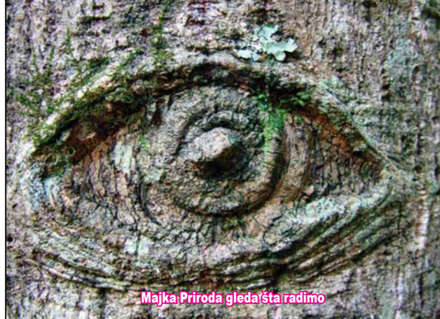
Majka Priroda gleda šta radimo

Na osnovu mišljenja Ministarstva za obrazovanje, nauku, kulturu, sport i informisanje Vlade TK broj 10/1-452-25-2/98 od 28. 08. 1998. god., list "Lovac" oslobođen je dijela poreza na promet