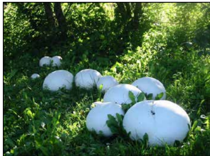
18 Lovac Juni 2014

Puhara je jedna od najvećih gljiva uopće. Sadrži amino-kiseline, ureu, ergosterol (provitamin vitamina D), masti i materiju nazvanu kalvacin ( calvatin ), koja je u eksperimen-