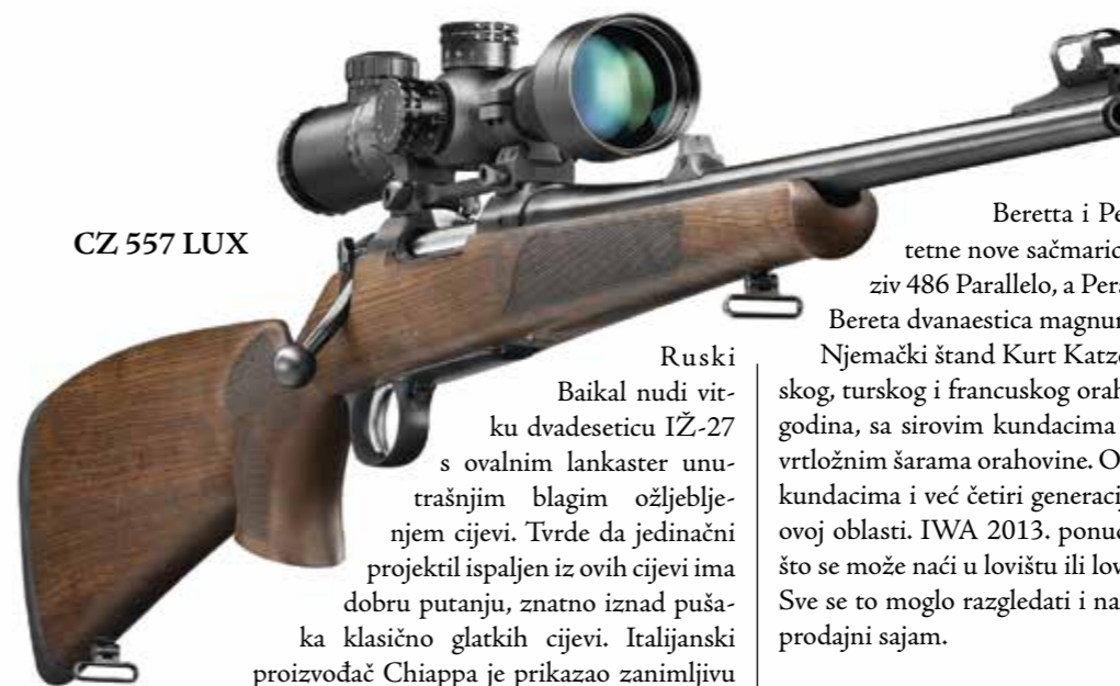
CZ 557 LUX

Masa klasičnih sačmarica položenih i bok cijevi je prikazana na sajmu IWA. Od dobro poznatih Sabatija, preko Ricinija, Zolija, Aye, Garbija, Pedra Arizabalage, Johana Fanzoja... U poplavi novih poluautomatskih sačmarica turskih, italijanskih, na Sajmu mnogo hvaljenih ruskih IŽ MP155 Baikal, ipak treba izdvojiti pravi novitet: FN Brauningov poluatomat A5. To nije onaj stari Browning Auto5, kod koga se cijev kretala unazad, već nova puška bazirana na inercionom radu zatvarača. Biće u kalibrima 12/76 i 12/89. Radi pouzdano sa svom municijom težine 28 do 66 g sačme. A5 ima sve Brauningove novitete integrisane u sebi: šire bušenje cijevi, produženi prelazni konus, 80 mm duge izmjenjive čokove i vrlo fini rad. Na istom principu inercije radi i osvježeni redizajnirani Benelijeve poluatomat Rafaelo, koji je odavno poznat i veoma cijenjen na tržištu.