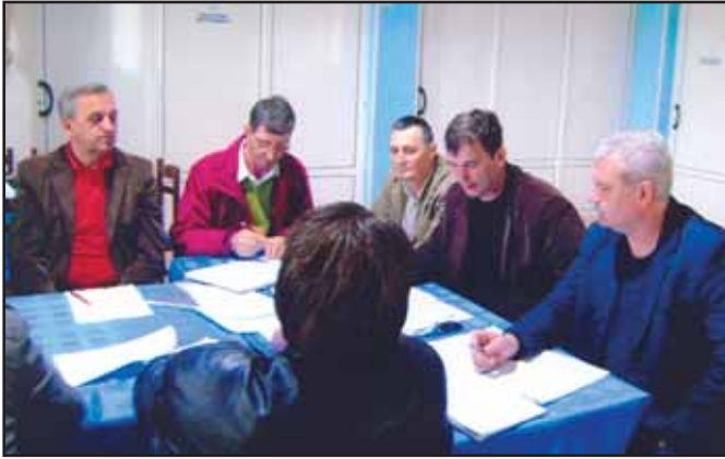
Održana redovna godišnja Skupština

Krajem marta ove godine održana je redovna godišnja Skupština udruženja na kojoj su delegati raspravljali o Izvještaju o radu Predsjedništva za 2010. godinu i Planu rada za 2011. godinu, usvojili Finansijski izvještaj za 2010., Finansijski plan za 2011. godinu i usvojili Izvještaj Nadzornog odbora o kontroli poslovanja Udruženja u proteklom jednogodišnjem periodu. Raspravljalo se i o utvrđivanju visine članarine za 2011. godinu, kao i donošenju Odluke o priznanjima i odlikovanjima za najzaslužnije članove Društva. Skupština je donijela i Odluku o izdvajanju finansijskih sredstava za obezbjeđenje poslovnog prostora za rad Udruženja, kao i izdvajanju finansijskih sredstava za nabavku terenskog vozila za potrebe lovučarske službe. Takođe, Skupština je izvršila verifikaciju delegata Begunić Samira iz Revira IV, koji je delegiran u Skupštinu udruženja na upražnjeno mjesto zbog smrti Hasana Sarajlića. U Predsjedništvo udruženja, umjesto Hasana Sarajlića, izabran je Kešetović Mehmedalija. Na osnovu podnesenog i u diskusijama potvrđenog Izvještaja o radu Predsjedništva udruženja, kao i Izvještaja Nadzornog odbora o kontroli poslovanja udruženja, delegati su jednoglasno konstatovali da je Predsjedništvo u protekloj godini, domaćinskim odnosom prema imovini i racionalnim trošenjem, ostvarilo višak prihoda nad rashodima čime su pokazali da se odgovornim odnosom i u ovoj oblasti mogu ostvariti vrlo dobri rezultati koji će dati doprinos razvoju lovstva i turizma u cjelini.