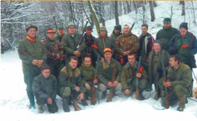
Lovačko društvo „Vjetrenik-Šibošnica“ Čelić